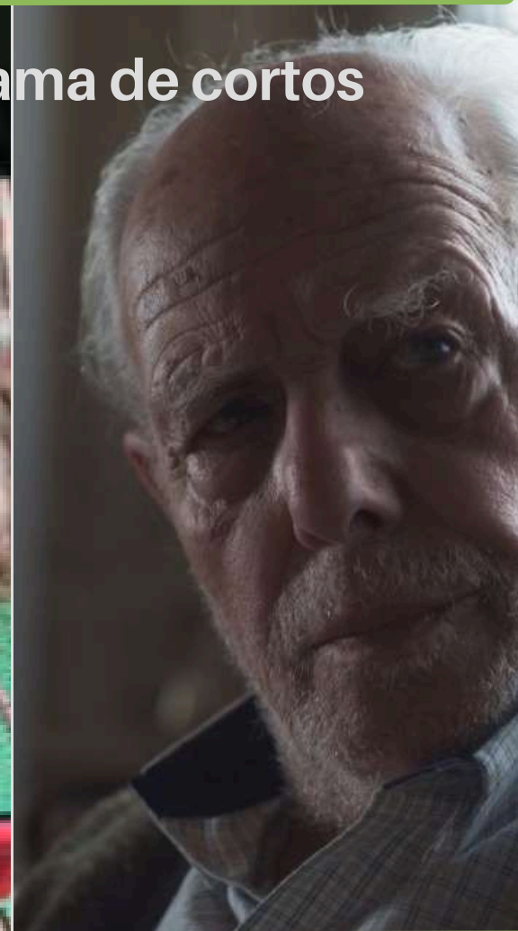
Asterion Dir: Eduardo Álvarez