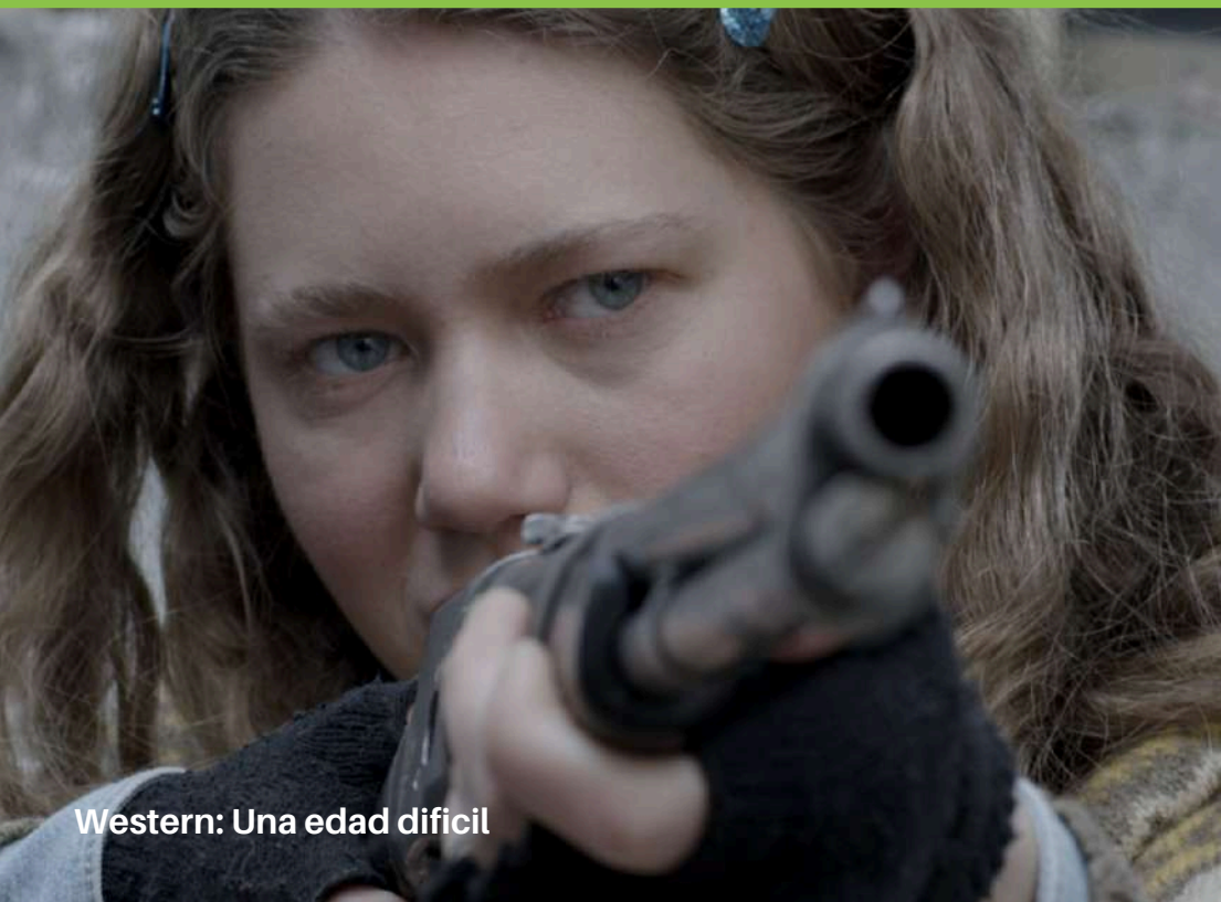
Western: Una edad difícil