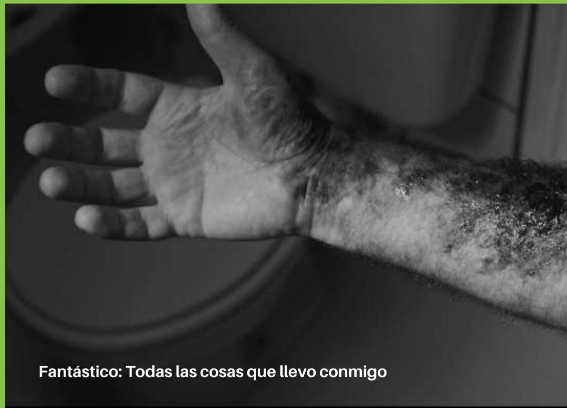
Fantástico: Todas las cosas que llevo conmigo