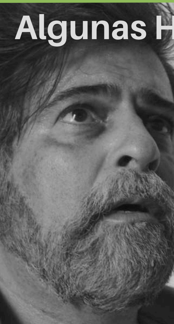
Todas las cosas que llevo conmigo Dir: Manuel García