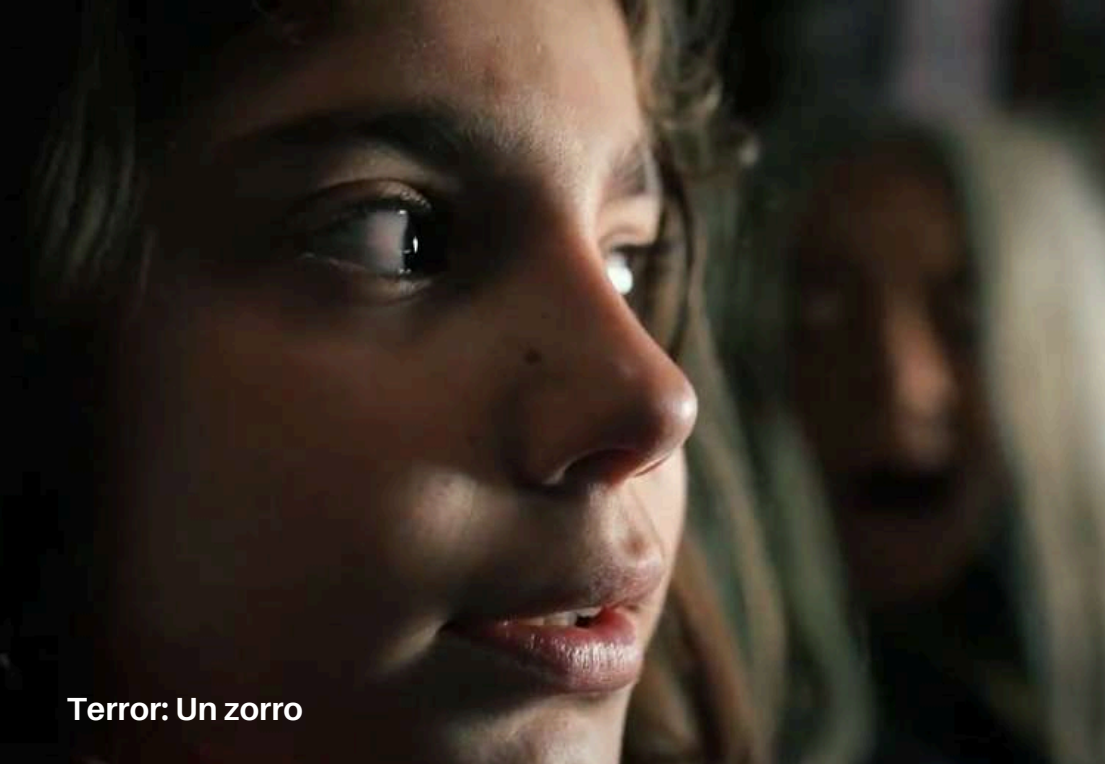
Terror: Un zorro