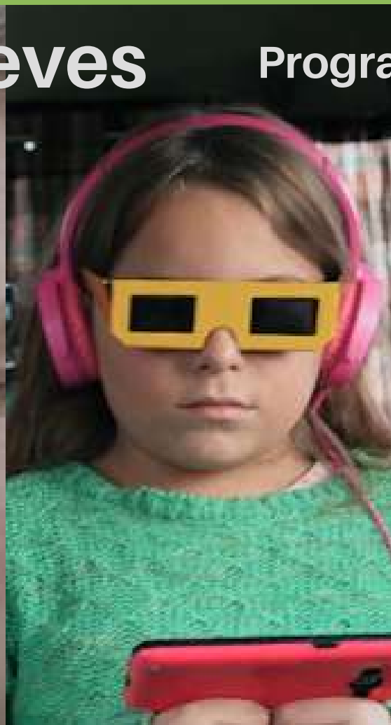
Un zorro Dir: Gastón del Porto